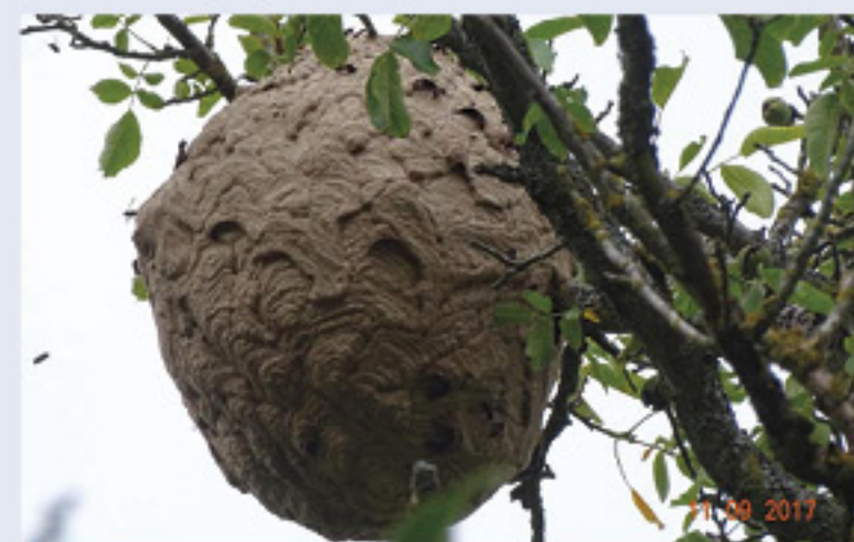
Une intervention pour détruire un nid secondaire de frelons asiatiques peut s'avérer périlleuse et coûteuse. Implanté souvent en hauteur, il abrite jusqu'à 13 000 individus.

À ce jour, les meilleures techniques de destruction utilisent une perche télescopique afin d'injecter de l'insecticide.