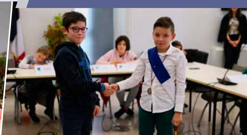
↑ PASSATION ↓