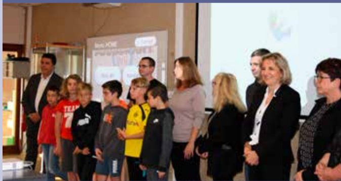
Tournoi de jeux vidéo du 20 octobre 2018 à la médiathèque