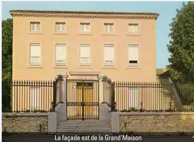
La façade est de la Grand'Maison