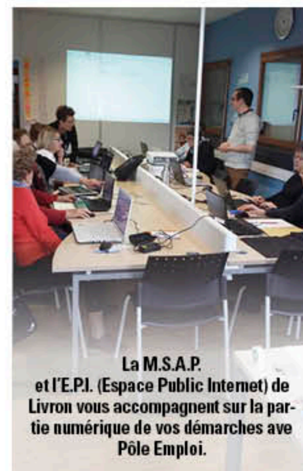
La M.S.A.P. et l'E.P.I. (Espace Public Internet) de Livron vous accompagnent sur la partie numérique de vos démarches au Pôle Emploi.

Le journal municipal et la presse annonceront la mise en œuvre officielle et les détails de cette action pour l'emploi.