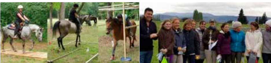
Les Cavaliers de la Cabriole - 725 route de Lacroix - 26250 Livron-sur-Drôme