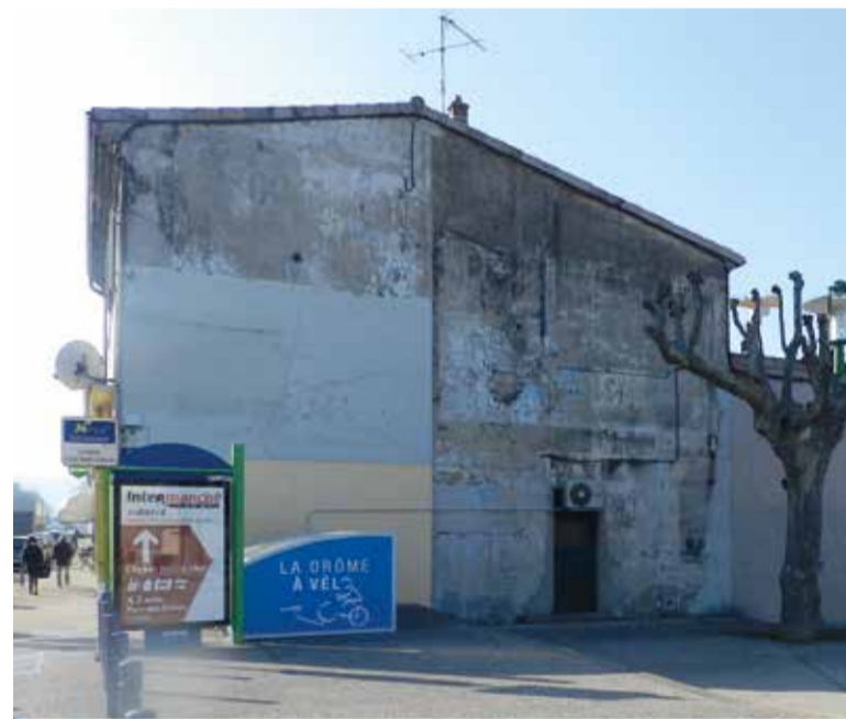
Fresque murale (la façade avant intervention).