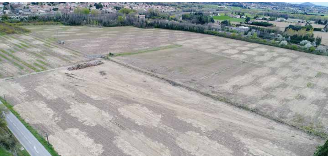
La zone de la Confluence vue d'un drone.

Mandataire (et membre unique) : SA LES JARDINS DE PROVENCE.