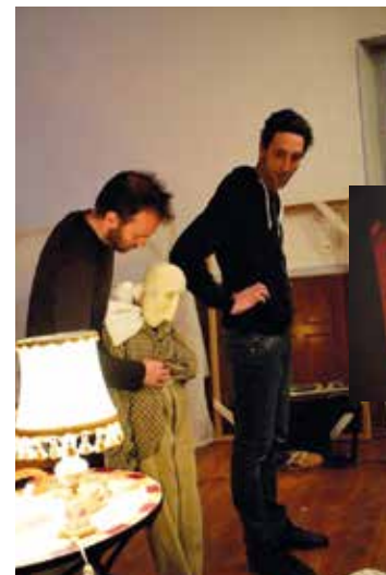
Haut Les Mains