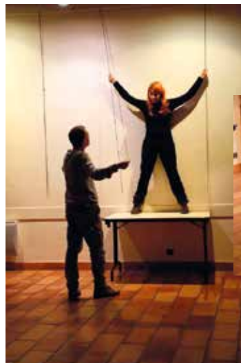
La Muse Errante

Nous vous invitons à rencontrer les artistes en résidence pour mieux comprendre comment naît un spectacle : la création, les contraintes, l'énorme travail qui est le leur.