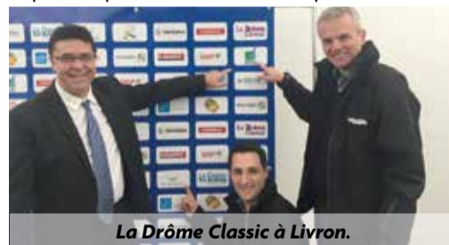
La Drôme Classic à Livron.

Nous avons prévu l'organisation d'une grande épreuve sportive par an, épreuve de grande envergure. Cela ne nuira en aucune façon aux associations livronnaises, dont les subventions seront totalement maintenues, au fonctionnement des installations sportives et à la vie associative. Au contraire, des partenariats entre les associations et les organisateurs de l'épreuve pourront être mis en place.