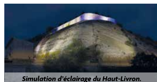
Simulation d'éclairage du Haut-Livron.