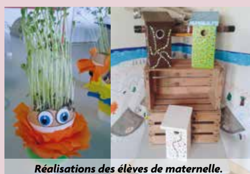
Réalisations des élèves de maternelle.