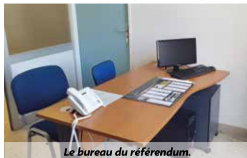
Le bureau du référendum.

Depuis le 25 mai 2015, un référendum portant sur l'organisation des pouvoirs publics, sur les réformes relatives à la politique économique, sociale ou environnementale, peut être organisé sous certains critères (1/5 e des membres du parlement et 1/10 e des électeurs inscrits sur les listes électorales). Cela permet aux parlementaires et électeurs de soutenir des propositions de loi en vue de les soumettre à un référendum. Ce soutien des électeurs peut être recueilli sur le site internet du gouvernement depuis son ordinateur personnel ( www.referendum.interieur.gouv.fr ) depuis une tablette ou un smartphone ou en mairie de Livron. À cet effet, la mairie de Livron-sur-Drôme (Service Citoyenneté) met à disposition pour cette démarche un accès internet pendant les