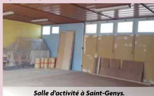
Salle d'activité à Saint-Genys.