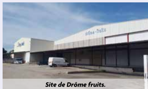
Site de Drôme fruits.

Profitons de cette annonce pour informer les riverains que, de juillet à décembre 2015, le site de Drôme Fruits, qui est un site de l'intercommunalité, accueillera une entreprise sinistrée de Loriol, ce site étant le seul de cette envergure sur notre territoire pouvant accueillir dans un si petit délai une entreprise ayant besoin de matériel réfrigérant pour stocker des fruits.