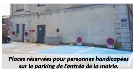
Places réservées pour personnes handicapées sur le parking de l'entrée de la mairie.