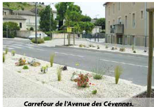
Carrefour de l'Avenue des Cévennes.