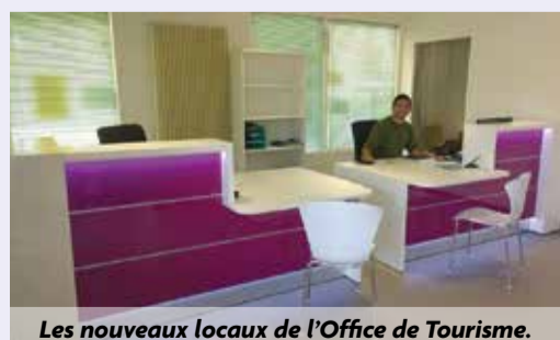
Les nouveaux locaux de l'Office de Tourisme.

Lancement opérationnel début septembre de l'Espace de co-working-télétravail au sein des locaux de l'Office de Tourisme de Livron. Un peu plus tard, au sein de la médiathèque municipale, lancement dans le même cadre d'un centre de visio-conférence à destination des entrepreneurs et autres personnes intéressées par la mise en place de rencontres à distance.