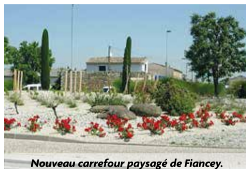
Nouveau carrefour paysagé de Fiancey.