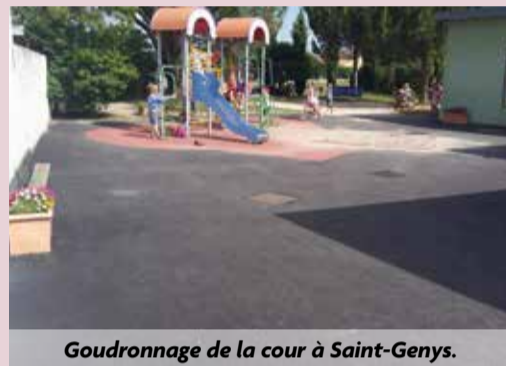
Goudronnage de la cour à Saint-Genys.

Aménagement d'un chalet extérieur pour stocker les jeux, etc. Goudronnage de la cour de la maternelle. Mise à disposition de quatre ordinateurs portables et de deux tableaux interactifs.