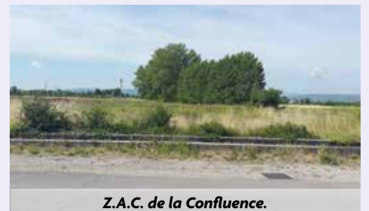
Z.A.C. de la Confluence.

• Lancement de la Z.A.C. de la Confluence. Fouilles archéologiques réalisées, modifications de la Déclaration d'Utilité Publique votée en juin 2015 à la Communauté de Communes du Val de Drôme, commissaire-enquêteur nommé fin 2014, enquête publique, dernières acquisitions, la dernière phase de lancement est en cours. Cette zone n'avait un véritable sens économique qu'une fois la déviation de Livron-Loriol actée. C'est désormais le cas ! 20 hectares seront ainsi ouverts à l'activité économique de Livron qui était en déficit de foncier économique.