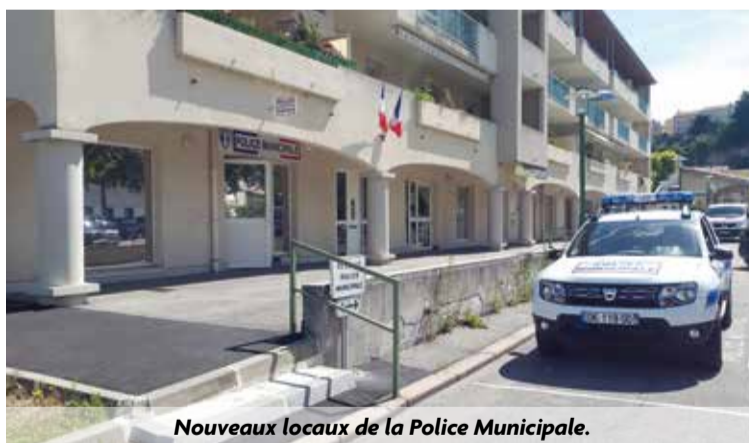
Nouveaux locaux de la Police Municipale.