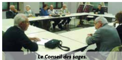
Le Conseil des sages.

Il a été installé par le maire le 16 avril dernier, a tenu une deuxième réunion fin mai, au cours de laquelle les « Sages » ont débattu de la Charte qui définit les principes de fonctionnement