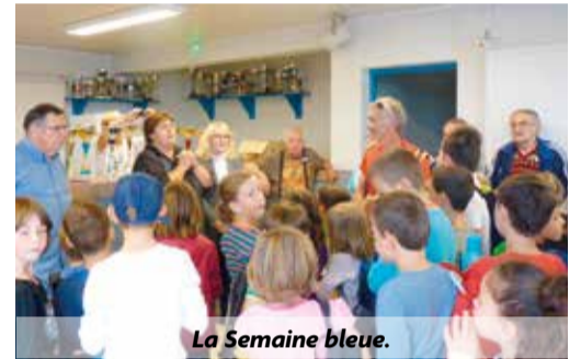
La Semaine bleue.

colaire et les seniors livronnais le mercredi après-midi,