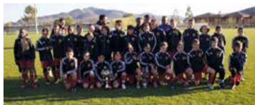
Le club du FC Rhône Vallées 2607

Au terme de 2 journées de matchs acharnés, rythmés par des victoires, des défaites, des cris de joie mais aussi quelques larmes, ce sont les U11 de Saint Priest et les U13 de Rhône Crussol qui se sont installés au sommet de la hiérarchie. Merci aux bénévoles et dirigeants du club qui ont œuvré ce week-end là et depuis plusieurs mois dans l'ombre, et sans qui, cet événement ne pourrait avoir lieu. Rendez-vous est déjà pris pour la saison prochaine !