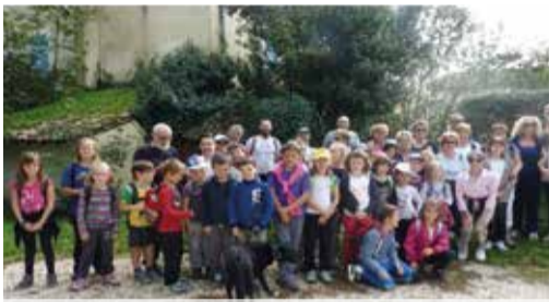
Départ pour la marche (Le Top départ au parc Pignal)