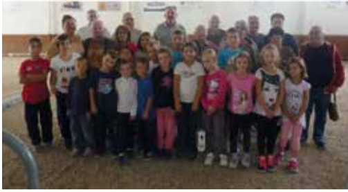
Jeu de Boules au Pétaquedrome (prêté par le Président M. Pella)

La semaine bleue est ouverte à tous les Livronnais, il n'est pas nécessaire d'être inscrit à l'un de nos clubs pour y participer.