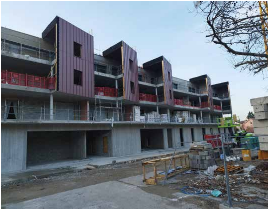
Le bâtiment qui hébergera le pôle santé place de la Madeleine est en cours de construction.

Un projet structurant est en cours de construction en plein centre-ville, dans le but de répondre à une double problématique, celle du logement et celle de la santé de proximité. Ce projet combine un pôle santé avec un ensemble résidentiel réalisé par SDH Constructeur. Situé Place de la Madeleine, à 15 minutes à pied de la gare et à proximité immédiate du centre-ville, il bénéficie d'un emplacement central et facilement accessible (lignes de bus, stationnement public à proximité).