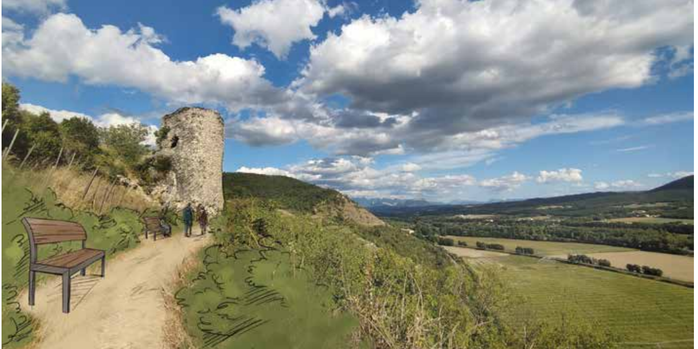
La réhabilitation de la Tour concernera aussi l'accès et ses abords.

Située au coeur des coteaux du Brézème, la Tour du diable surplombe les vallées de la Drôme et du Rhône. Tour d'angle de la première enceinte de la vieille ville construite vraisemblablement au XII e siècle, elle est l'un des rares vestiges épargnés durant les destructions du XVI e et XVII e siècles. Bien que non protégée au titre des monuments historiques, la Tour du diable constitue un patrimoine particulièrement marquant du paysage local et participe à l'identité de la commune de Livron-sur-Drôme. La commune a donc lancé des démarches en 2023 avec la volonté de préserver cette construction livronnaise emblématique en collaboration avec l'UDAP (Unité Départementale de l'Architecture et du Patrimoine).