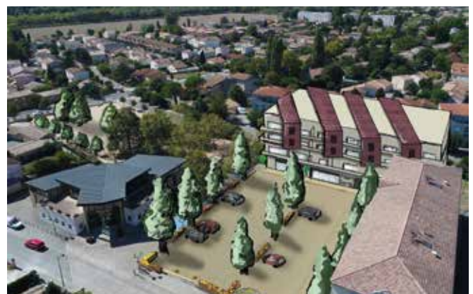
Autour du pôle santé, les places de la Madeleine et Vignaux seront aussi réaménagées.

Une belle lueur d'espoir pour les Livronnais qui peinent depuis plusieurs années maintenant à trouver un médecin généraliste de proximité.