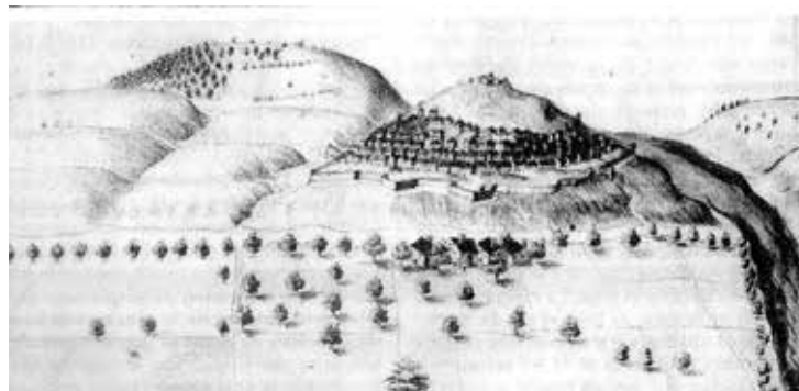
Livron en 1608 - Dessin d'Henri de Beins, Ingénieur d'Henri IV.

Merci à Ronan Capron pour son aide précieuse.