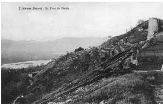
La Tour du diable est un symbole identitaire fort de la ville.

Située au coeur des coteaux du Brézème, la Tour du diable surplombe les vallées de la Drôme et du Rhône. Tour d'angle de la première enceinte de la vieille ville construite vraisemblablement au XII e siècle, elle est l'un des rares vestiges épargnés durant les destructions du XVI e et XVII e siècles. Bien que non protégée au titre des monuments historiques, la Tour du diable constitue un patrimoine particulièrement marquant du paysage local et participe à l'identité de la commune de Livron-sur-Drôme. La commune a donc lancé des démarches en 2023 avec la volonté de préserver cette construction livronnaise emblématique en collaboration avec l'UDAP (Unité Départementale de l'Architecture et du Patrimoine).