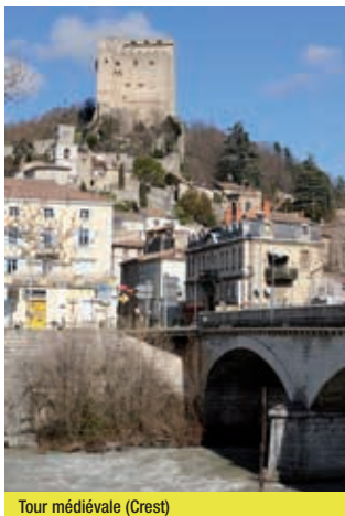
Tour médiévale (Crest)