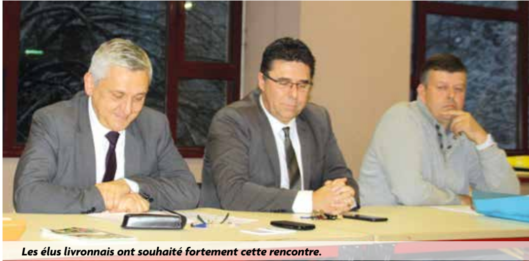
Les élus livronnais ont souhaité fortement cette rencontre.