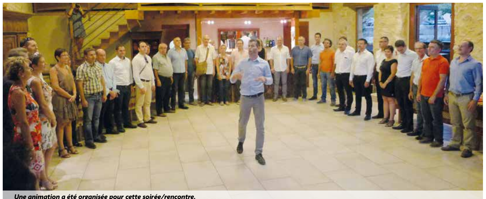
Une animation a été organisée pour cette soirée/rencontre.