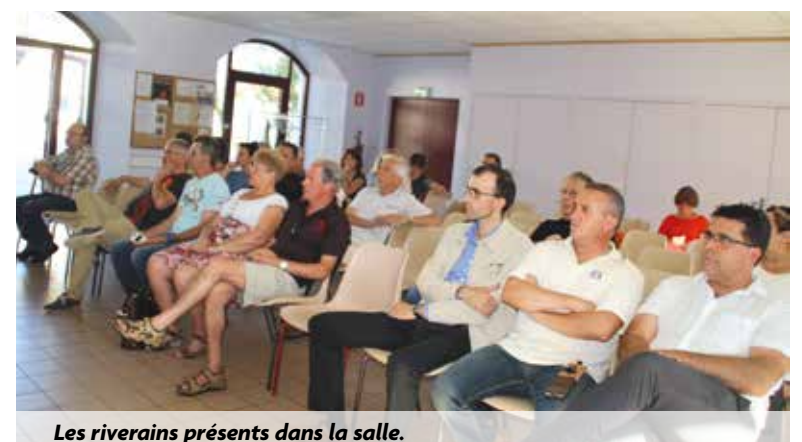
Les riverains présents dans la salle.

D'autres réunions publiques seront donc organisées par la Commune pour gérer au mieux l'évolution de ce site qui ne pouvait rester en l'état. On ne peut plus avoir d'aménagement industriel en cœur de ville (circulation de poids-lourds) et on ne peut pas continuer à voir un site industriel se transformer en friche dans un quartier en partie résidentiel.