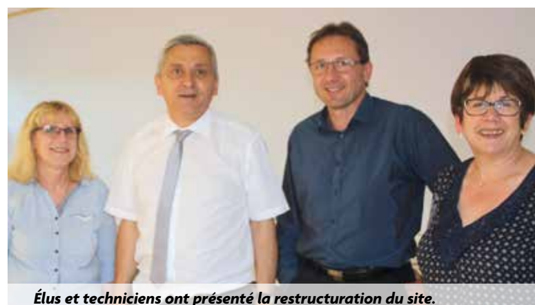
Élus et techniciens ont présenté la restructuration du site.

L a Commune et la Communauté de Communes ont souhaité présenter le projet de réaménagement aux riverains de Drôme Fruits ainsi que sa déconstruction préalable. Nous l'avons relaté à plusieurs reprises : ce site va être déconstruit, dépollué, et sera remplacé par deux bâtiments économiques pour environ 3000 m 2 et un quartier de