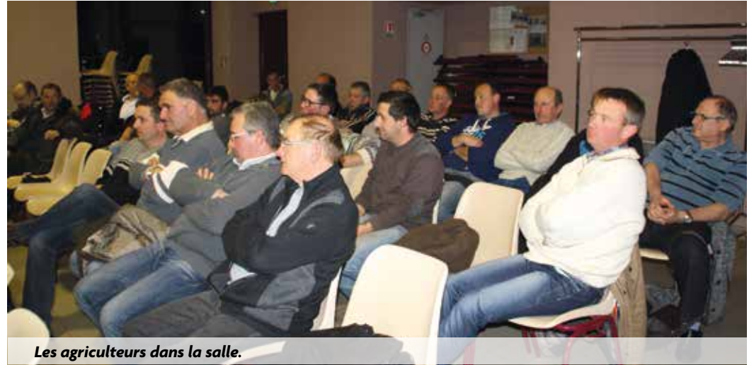
Les agriculteurs dans la salle.

Le secrétariat du Maire organise les rendez-vous. Un des objectifs du premier adjoint est aussi de faire adapter la politique agricole de la Communauté de Communes du Val de Drôme aux réalités de l'agriculture de la zone de la Confluence. C'est du moins ce qui est ressorti de la réunion publique, organisée à la demande de la Commune, avec les agri-