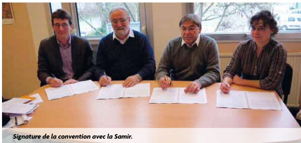
Signature de la convention avec la Samir.