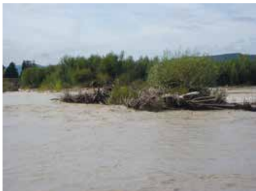
La Drôme en crue, juste en amont de la passe à poissons.

Le diagnostic hydraulique complémentaire réalisé en octobre 2015 a conclu à une augmentation du risque inondation des communes riveraines de la Drôme du fait d'une accumulation de graviers dans le lit mineur de la rivière. La municipalité s'est engagée pour contribuer à réduire ce risque. En effet, un mandat a été donné au Syndicat Mixte de la Rivière Drôme (SMRD) pour porter la démarche d'extraction de 50 000 m 3 de matériaux dans le lit de la rivière. Parallèlement, des travaux de sécurisation de l'ouvrage hydraulique de Palère sont à l'étude. Une demande de dotation auprès des services de l'État est en cours pour aider à financer ces projets.