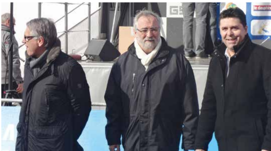
Les élus territoriaux ont travaillé ensemble pour obtenir cette course de renom.