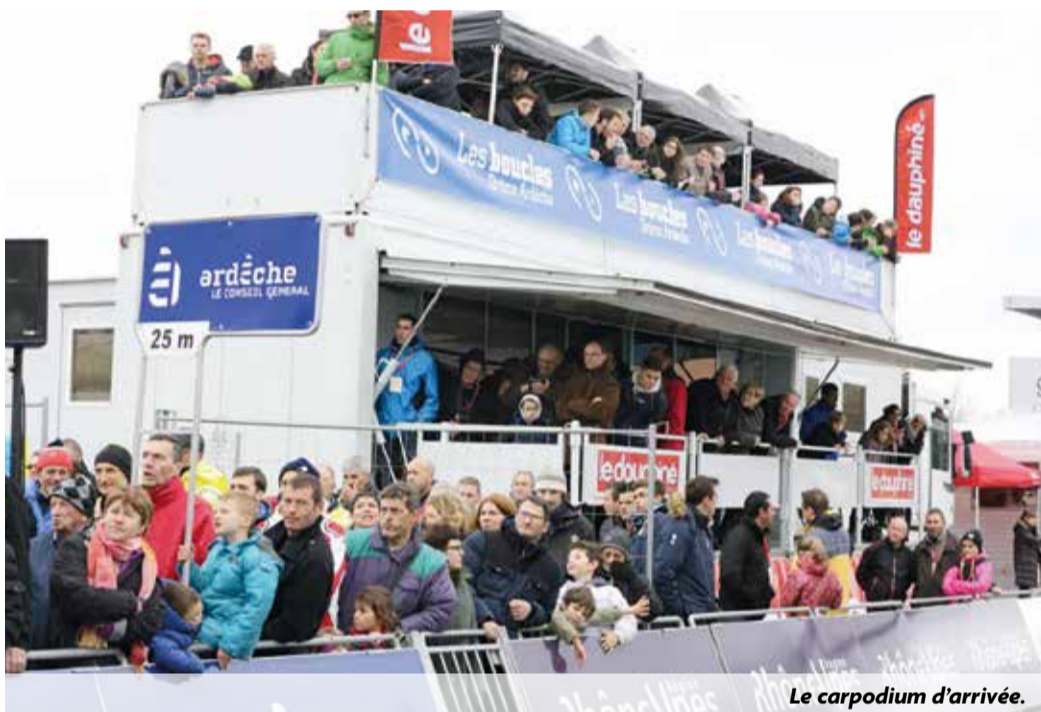
Le carpodium d'arrivée.