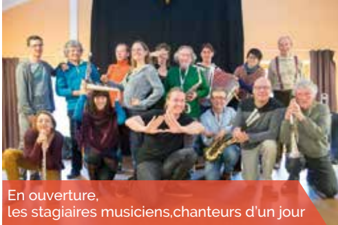
En ouverture, les stagiaires musiciens, chanteurs d'un jour